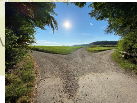
Pfosten Nr. 6 Parkplatz Sennhof