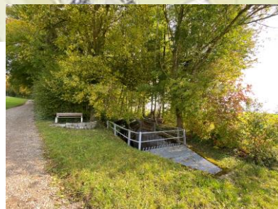
Pfosten Nr. 7 Sitzbank bei Fuchstobelbach oder ausgangs Rigiweg

Bei den Standorten kann es noch zu kleinen Abweichungen kommen