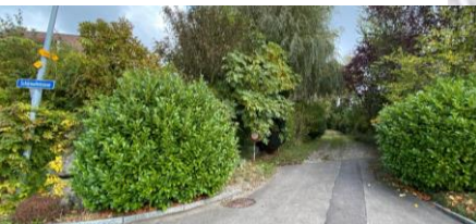
Pfosten Nr. 1 Kreuzung Foregass - Schürmattstrasse