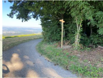
Pfosten Nr. 3 Grillplatz beim Waldrand