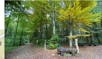
Pfosten Nr. 4 Anfangs Kreuzweg bei Waldhütte