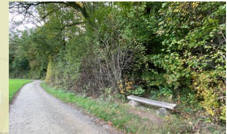
Pfosten Nr. 5 Waldrand, Grenze zu Spreitenbach