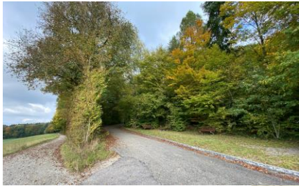
Pfosten Nr. 2 Unter Reservoir beim Waldrand